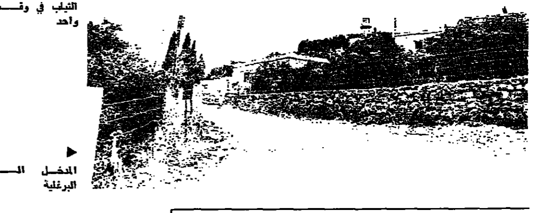
صيدا - من مراسل « الانوار » : جودت لبنان الاخرة ، عزلت الجنوب اكثر من اي وقت عن الاهتمام الرسمي حتى بات الحديث عن حرمان قرى الجنوب حديثا في غير محله . لكن مجرد تجاهل المشكلة لا يحل والحياة تآسفة على الجنوبيين نسبي ظل الوضع الراهن والاهمال الملائم لقرتهم .